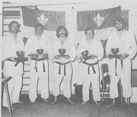
Voici les vainqueurs

Il ne faut cependant pas oublier l'organisation sérieuse qui a soutenu une telle journée. Nous parlons surtout de ceux dont on ne sait jamais les noms, mais qu'on nomme, comme pour s'excuser, les organisateurs. Ceux dont le travail se passe toujours dans les coulisses et qu'on n'applaudit pas souvent et même très rarement. Aux autorités de la polyvalente de Mortagne, aux gars qui ont placé chaises, laramis, tables; à ceux qui ont tenu le guichet; aux arbitres, aux officiels, en particulier aux chronomètres; nous dedions nos plus sincères félicitations pour leur travail silencieux, mais combien important et indispensable.